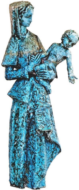
Afb. 6. Maria met Kind, keramiek, ca. 1960, Ateliermuseum Jac Maris

Uitgave van Stichting Ateliermuseum Jac Maris