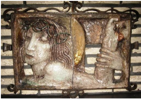
Afb. 1. Elfde statie. Jezus wordt aan het kruis geslagen, keramiek, 1950, Den Bosch