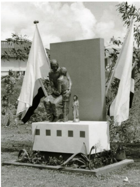
Afb. 4. Wijding Christus met puber, 1958, Mgr Zwijsencollege Willemstad