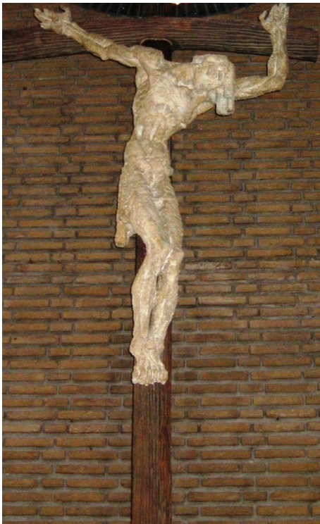
Afb. 2. Crucifix, 1951, Den Bosch