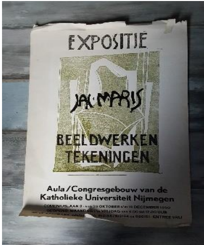
Affiche expositie Aula van de Katholieke Universiteit Nijmegen