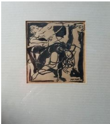
Tekening Jac Maris