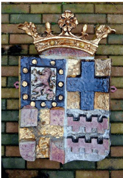
Gemeentewapen van Millingen aan de Rijn, Ateliermuseum Jac Maris