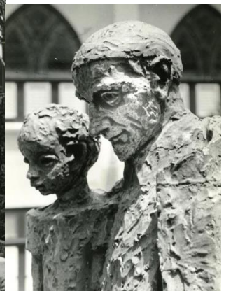
Afb. 5. Vincentius a Paolo, keramiek, 1960, Vincentiusstichting, Curacao (met detail)