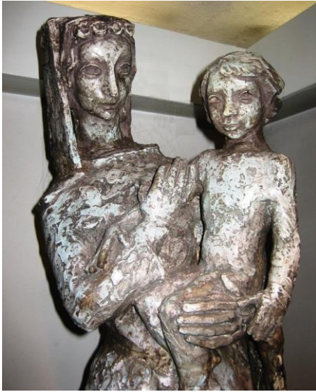
Afb. 3. Maria met kind, keramiek, 1960, herkomst Fraterhuis Eindhoven

Uitgave van Stichting Ateliermuseum Jac Maris