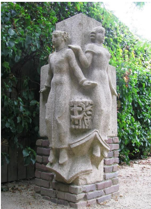
Afb. 2. Proza en Poësie gevelreliëf Kloosterman, 1950