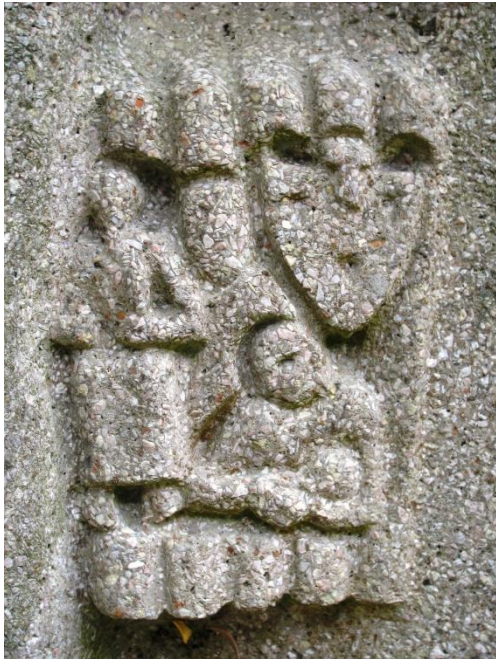
Afb. 3. Gezin en opvoeding

Uitgave van Stichting Ateliermuseum Jac Maris