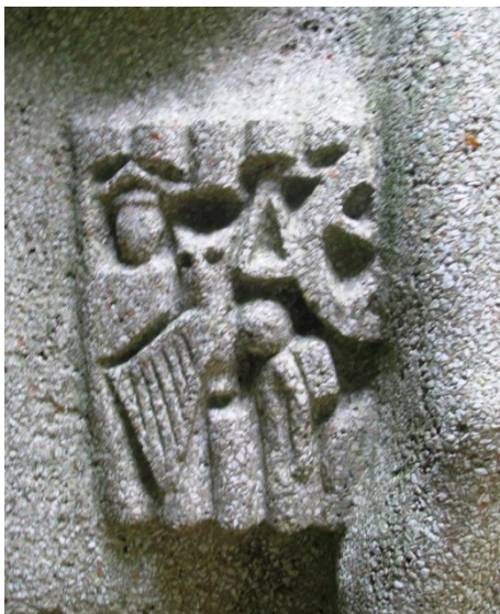
Afb. 4. Engelbewaarder

Zoals meestal bij opdrachten van monumentaal werk, kiest Maris een onderwerp dat iets vertelt over de functie van het bedrijfspand. Kloosterman is een boekhandel, daarom zien we proza en poëzie gepersonifieerd in de vorm van een man voor het proza en een vrouw voor de poëzie (afb. 2). Ze zijn verbonden door boeken die aan hun voeten liggen.