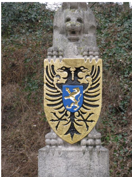
Afb. 2. Leeuw gevel stadhuis, 1941, nu Veerpoorttrappen