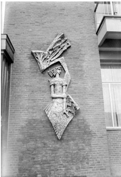
Afb. 5. De Vier Seizoenen, Jorisstraat, 1959

Minder bekend is de grote keramische meisjesfiguur, die staat voor de Vier Seizoenen, die in 1959 op een gevel op de hoek van de Jorisstraat en het Trajanusplein is aangebracht (afb. 5).