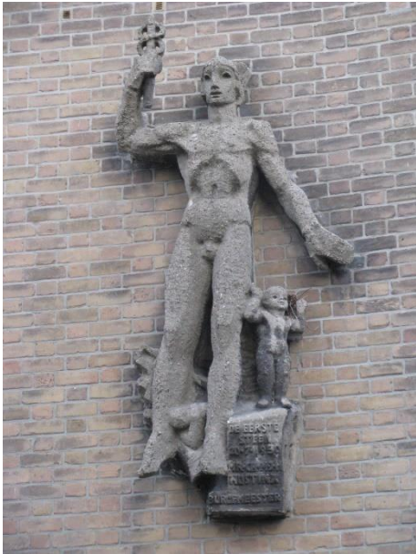
Afb. 3. Mercurius, Plein 1944, 1951

Uitgave van Stichting Ateliermuseum Jac Maris