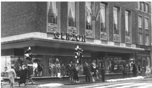
Afb. 4. Reliëfs, Gerzon Burchtstraat, 1954