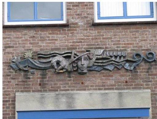
Afb. 6. Postkantoor Dominicanenstraat, 1957