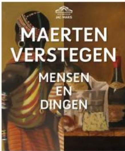
Affiche tentoonstelling Maerten Verstegen