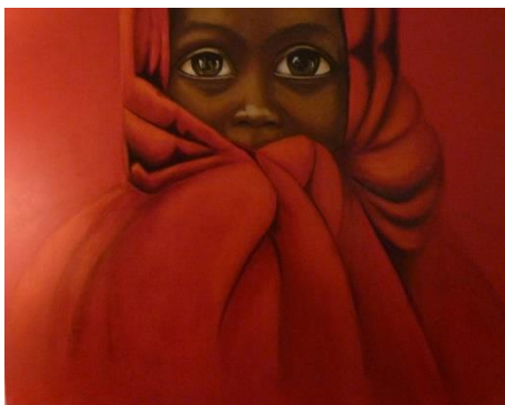
Afrikaans meisje in rood olieverf op doek 50 x 60 cm

Meer werk en informatie vindt u op de website van Maerten Verstegen: http://www.maertenverstegen.nl