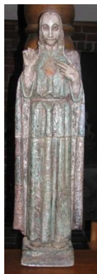
Jac Maris, Heilig Hartbeeld

Uitgave van Stichting Ateliermuseum Jac Maris