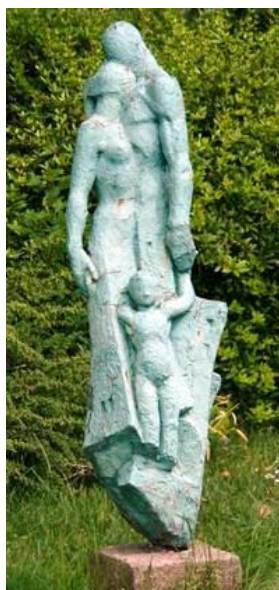
Jac Maris, Maatschappij ontwikkeling, berustend op gezinsvorming

Na de stormramp van 1925 die op 10 augustus raasde over een groot deel van Oost-Gelderland, werd in Borculo een stichting opgericht met het doel huizen te bouwen. Ter gelegenheid van het 40-jarig jubileum van deze stichting maakte Maris dit beeld van een man, een vrouw en een klein kind.