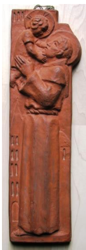
Afb. 3. Antonius, terracotta, 36 x 11 cm.