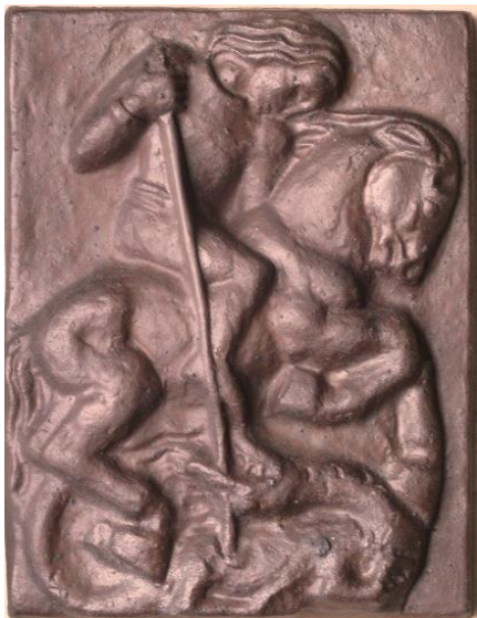
Afb. 2. Sint Joris, ijzerklinker, 24 x 15 cm.