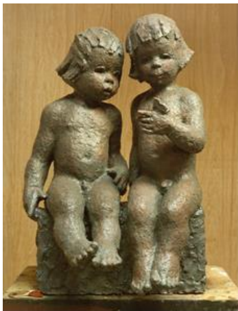
Els Tervoort, kinderen