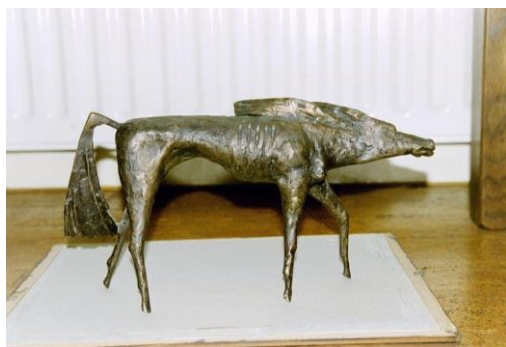
'Paard in de wind' door Jac Maris.

Het museum heeft van de familie Tervoort een royale schenking gekregen van zo'n dertig werken.