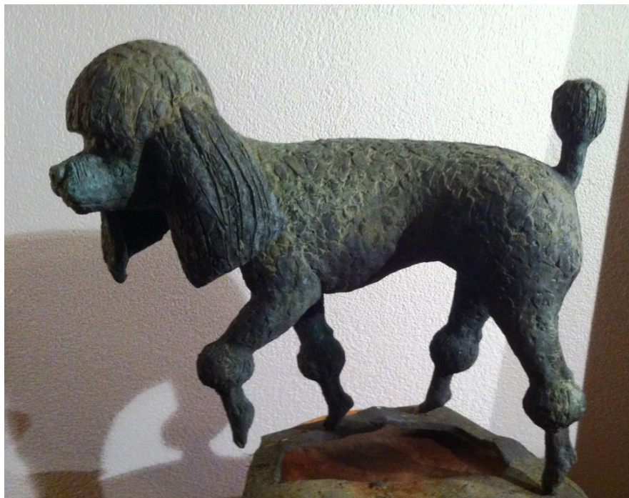
'De poedel' door Jac Maris. Dit beeld stond vroeger op het dak van het Marishuis.