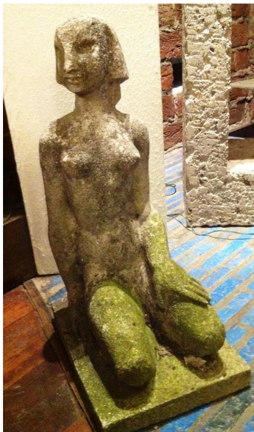
'Het meisje' door Els Tervoort.